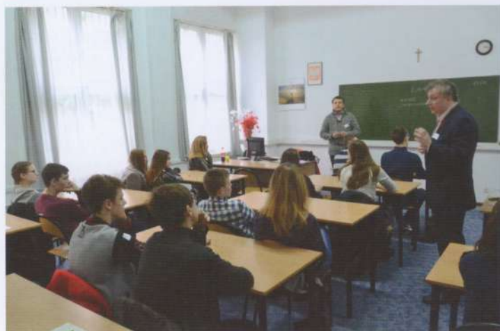
Lekcja o finansach z dyrektorem Banku Gospodarstwa Krajowego i trenerem z Centrum Edukacji Obywatelskiej.