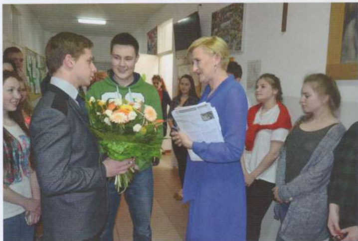
Maturzyści składają podziękowania Pierwszej Damie. Od września 2015 r. Pani Agata Kornhauser-Duda prowadzi zajęcia dodatkowe z języka niemieckiego.

Fotorelacje z kilku wybranych wydarzeń. Prosimy zaglądnąć na stronę www.liceumpolonijne.edu.pl oraz na nasze profile na facebooku.