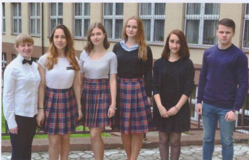
Zwycięzcy konkursów: historyczno-literackiego i przyrodniczego (foto J. Strzałkowski).

Tradycją naszej szkoły są konkursy: Przyrodnik Roku i Wielkie postacie w historii Polski. Konkurs przyrodniczy wymaga wiedzy z geografii, fizyki, biologii i chemii, dzięki czemu pozwala pełniej spojrzeć na zjawiska otaczającego nas świata. Natomiast konkurs historyczno-literacki daje szansę poznania losów najwybitniejszych Polaków. Bohaterowie prac uczniów mogą stać się w ten sposób wzorem i drogowskazem na ich życiowych drogach.