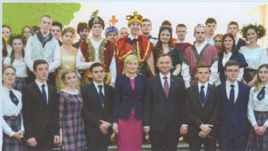
Para Prezydencka z uczniami - artystami